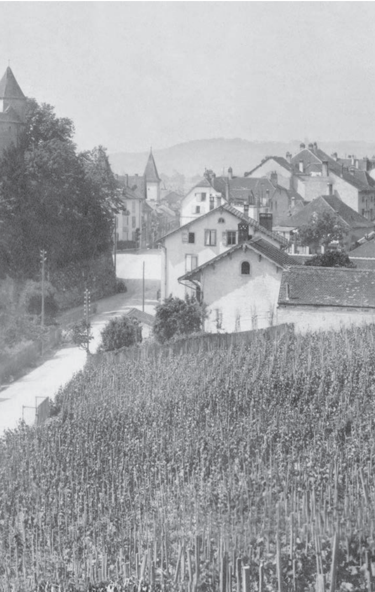
La tourelle de Gex en 1920, qui marquait autrefois l'angle sud-ouest de la muraille du bourg. A droite, on distingue l'enseigne de la quincaillerie Glardon-Grobet.