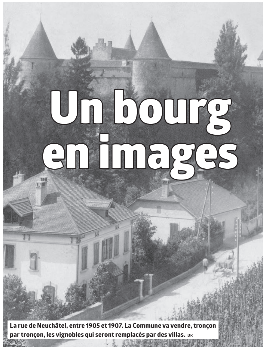
La rue de Neuchâtel, entre 1905 et 1907. La Commune va vendre, tronçon par tronçon, les vignobles qui seront remplacés par des villas.