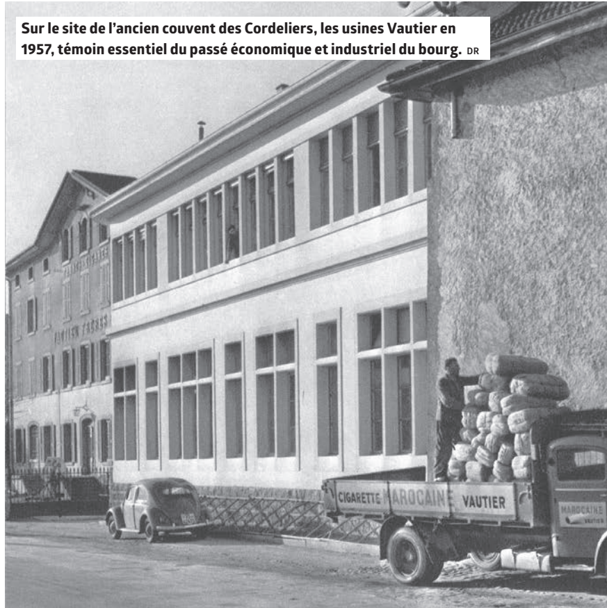
Sur le site de l'ancien couvent des Cordeliers, les usines Vautier en 1957, témoin essentiel du passé économique et industriel du bourg.